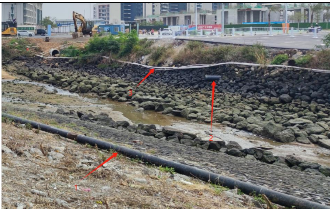
图 2-1 项目现状图

项目现状图如图 2-1 所示，其中标识 1 为通信管线、标识 2 为污水管线、标识 3 为雨水管线，均为东面华侨城项目的临时穿越管线。项目建成后，华侨城的污水、雨水及通信管线均可接入本项目。运营期，本项目建设范围内不涉及管线检查井。