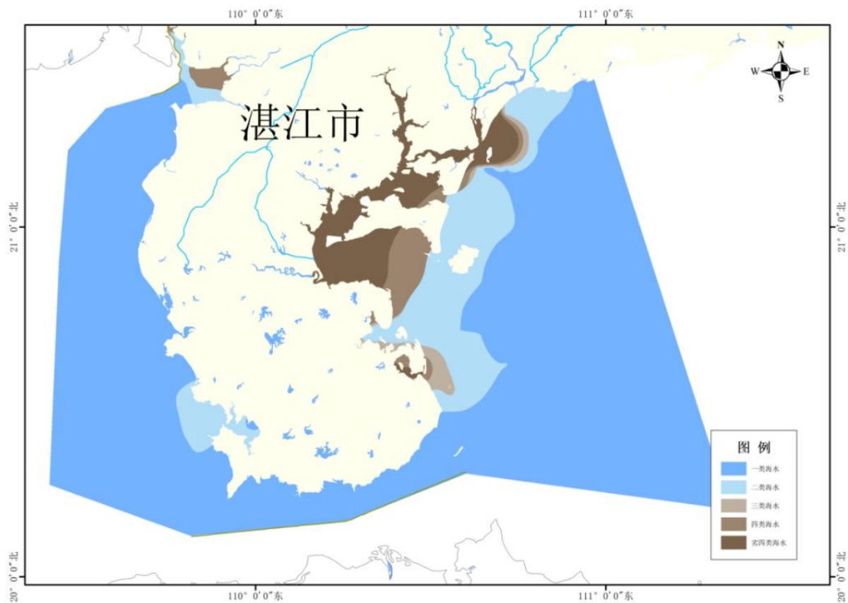
图 3-3 2022 年秋季湛江市近岸海域水质状况示意图（面积法）